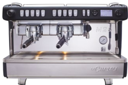
M26 TE DT2 TALL CUP ALSO AVAILABLE