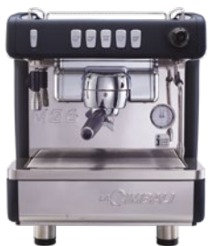
M26 TE DT1 — DT2 COMPACT TALL CUP ALSO AVAILABLE