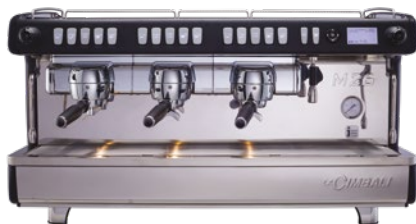
M26 TE DT3 TALL CUP ALSO AVAILABLE